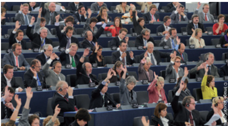
Európsky parlament – miesto, kde môže zaznieť aj váš hlas.

V roku 2011 bol za predsedu Parlamentu zvolený Nemeck Martin Schulz (Progresívna aliancia socialistov a demokratov).