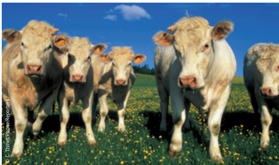
Poľnohospodárstvo musí zaisťovať bezpečné a kvalitné potraviny.

Európska komisia zastupuje EÚ na medzinárodných rokovaníach v rámci Svetovej obchodnej organizácie (WTO). EÚ chce dosiahnuť, aby WTO kladla väčší dôraz na kvalitu potravín, princíp prevencie („je lepšie byť opatrný ako neskôr ľutovať“) a dobré životné podmienky zvierat.